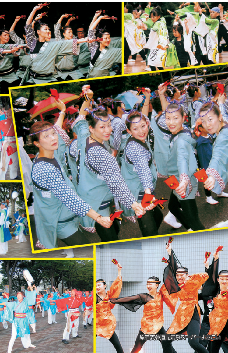
原宿表参道元氣祭スパーよさこい

2005年6月1日発行 第10号 東京都渋谷区神宮前4-3-6 伊藤病院広報誌委員会