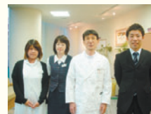
大須診療所のスタッフ

約1年間勤務してみて、この地域にも甲状腺専門病院を必要とされている方が沢山いらっしゃるという事を実感することができました。実感したこと一つ一つを大切に、今後も安心して受診していただけるような診療所を目指してがんばっていききたいと思います。